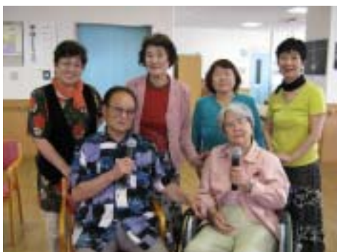
濃州神陰流桔梗館の舞